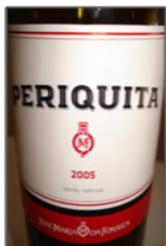
Texto (2) – parte 1

Ora, por outro lado, interessará verificar que a atividade publicitária é uma prática complexa, na medida em que ela está controlada e regulamentada, isto é, é uma prática influenciada por diversas normativas e códigos. Por exemplo, no caso de Portugal existe especificamente um código da publicidade que regula essa prática. A questão mostra que também é preciso observar os modos como as diversas atividades interagem entre si.