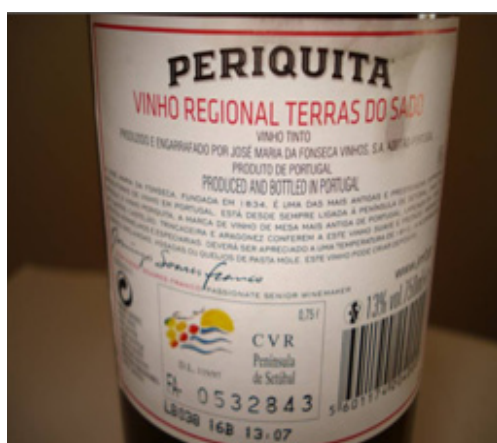
Texto (2) – parte 2

O texto (2), que se organiza em duas grandes partes, é um rótulo do mesmo vinho português publicado no texto (1). Se observarmos a sistematização proposta por Marcuschi, diremos que esse gênero se inscreve no domínio da atividade comercial. Todavia, além dessa inscrição indiscutível no domínio comercial, o gênero (à diferença de outros do mesmo domínio como a nota de venda, a carta comercial e o bilhete de avião) apresenta uma forte dimensão publicitária. De fato, grande parte do que se diz em um rótulo se orienta por essa finalidade publicitária. O rótulo não serve apenas para identificar um produto, mas também para provocar a compra do produto (cf. MIRANDA; COUTINHO, 2008). Isso implica que associar esse gênero somente à atividade comercial não permite dar conta do funcionamento social do gênero. Em